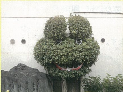
元気になってカエル（病院玄関横）