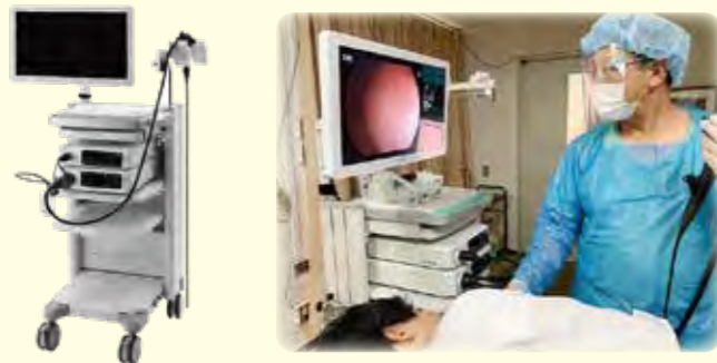
(令和3年6月新機種更新 富士フィルムLASERE07000)