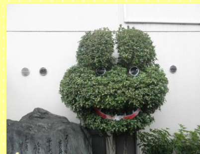
元気になってカエル(病院玄関横)