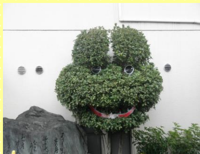
元氣になってカエル（病院玄関横）