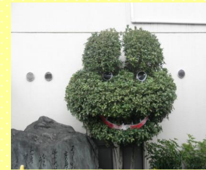
元気になってカエル (病院玄関横)