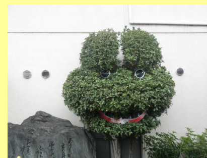
元気になってカエル (病院玄関横)